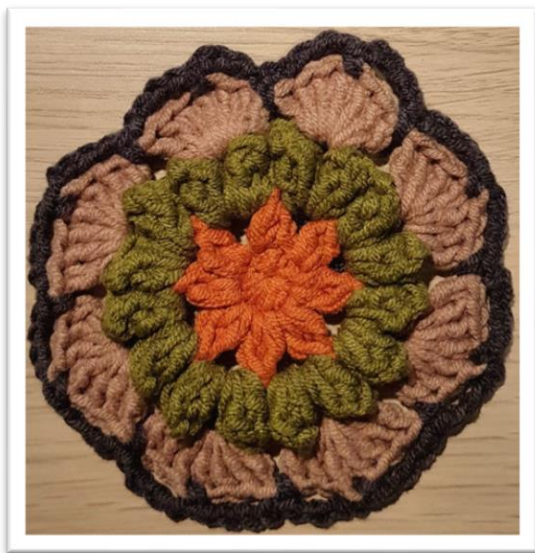
(1 e cirkel)

Toer 5: 1 V, in dezelfde steek waar je van kleur bent veranderd (zie foto 3), "4 L, 1 V op het 4e stokje (midden van de boog van 7 stokjes vorige toer), 4 L, 1 V (tussen de 2 boogjes van 7 stokjes)", herhaal 7x wat tussen "" staat, sluit de toer met een HV.